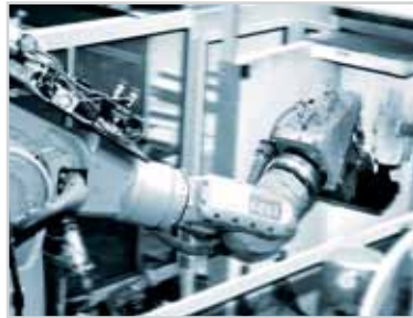
系统化制造 高度自动化生产线使时间和成本最小化。