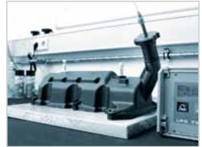
100%泄漏测试 每个气缸盖罩都进行过密封完整性测试。